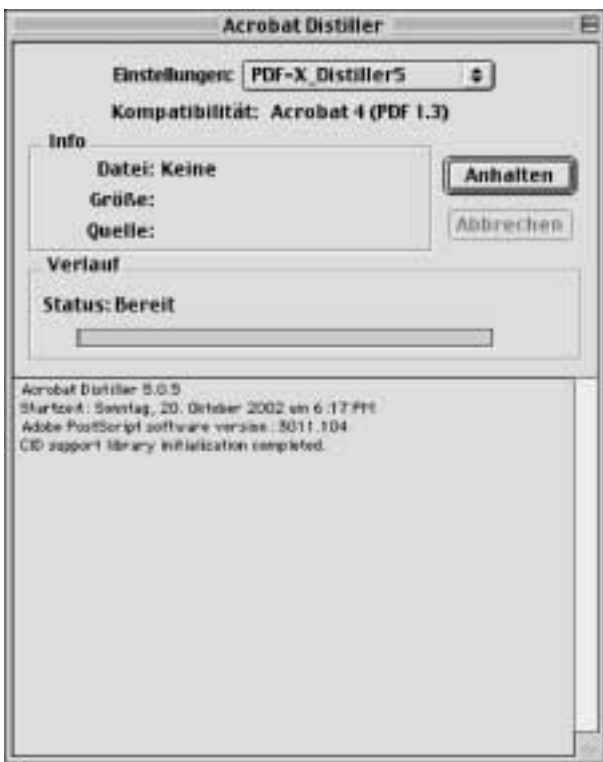
PDF-X_Distiller5 joboption einstellen