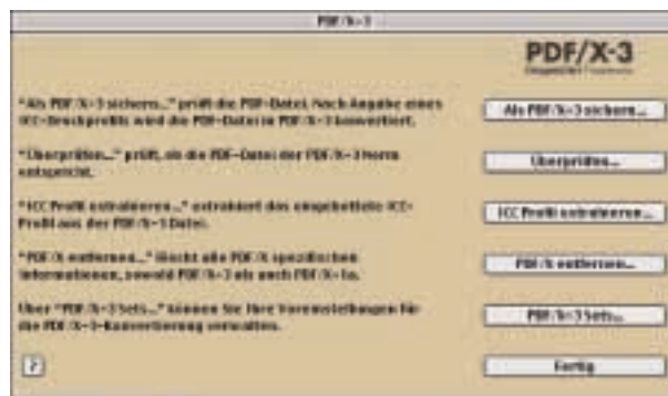
Hauptdialog des PDF/X-3 Inspector