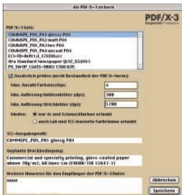
Auswahl der geplanten Druckbedingung sowie optional zusätzlicher Prüfeinstellungen