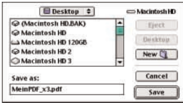
Angabe des Ablageortes für die PDF/X-3-Datei

Sofern PDF/X-3 Inspector keine Probleme festgestellt hat, erhält man die Bestätigung, dass die Konvertierung nach PDF/X-3 erfolgreich war.